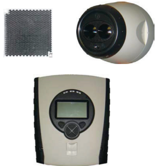
Detector lineal de humos motorizado Mod. F5000 M/S

La compensación automática mediante el control inteligente de la barrera dilata los tiempos de mantenimiento, permitiendo la lectura de niveles y el reajuste en cualquier momento, desde la unidad de control.