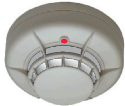
Detector Termovelocimétrico/Térmico Convencional Mod.ECO1005 A / ECO1005T A / ECO1004T A

Las bases compatibles incorporan una lengüeta de continuidad para mantener la línea de detección activa en caso de extracción del equipo con resorte de rearme en caso de volver a instalar un detector. Las pruebas de activación del equipo (Test) se realizan mediante un pulsador de rayo láser codificado.