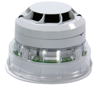
El detector se compra por separado

Nota importante: Para que el producto obtenga la clasificación IP, debe instalar la pieza selladora que se suministra con el equipo.