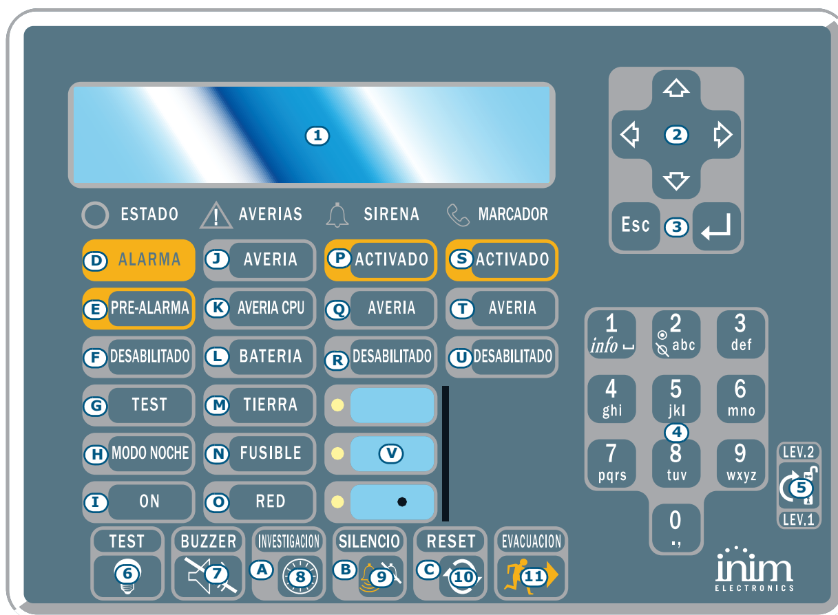
Figura 1 - Panel frontal de la central

El panel de control SmartLoop controla hasta 15 consolas, la consola principal se ubica en la placa frontal del panel (sólo modelos "/G" y "/P"), y hasta 14 consolas opcionales compuestas por repetidores SmartLetUSee/LCD conectables al BUS RS485.